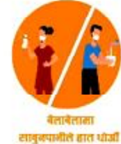
बैलाचैताका सामुप्रीति हात धाँचौं