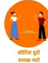
भौतिक दूरी कायम गर्औं